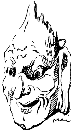
(平石長久 社会保障研究所)

(以上5編の「ISSA海外論文要約より」は、社会保障研究所の要請に対するISSAのAdvisory Committee——1967年10月——による了解にもとづき、Social Security Abstractsより採用した)。