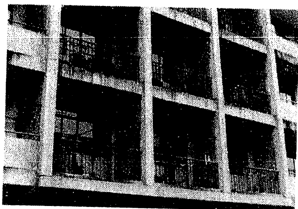
上海第一福利院(旧ビル)