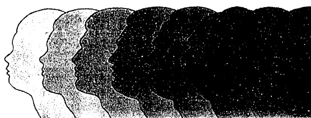
老年学研究所の紹介パンフレット

現在)の研究調査プロジェクトには、公的サービスの多様化に関する研究や、後期高齢者の長期追跡調査(longitudinal studies)がある。後者はOCTO-Studyと呼ばれるもので、1987年および1989年に84-94歳の高齢者を面接調査したもので、1991年に再度調査することになっており、以降も続く計画である。この大規模な調査では、援助のニーズ、サポートの種類、痴呆や記憶に関する体力および知力のテストなどがりまく網羅されている。